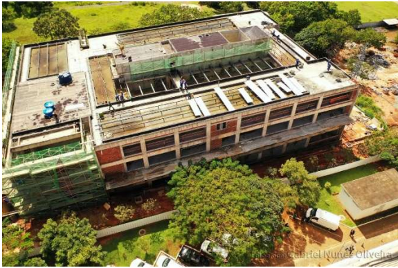
01 – Trabalhos na cobertura: impermeabilização com manta, proteção mecânica e telhado.