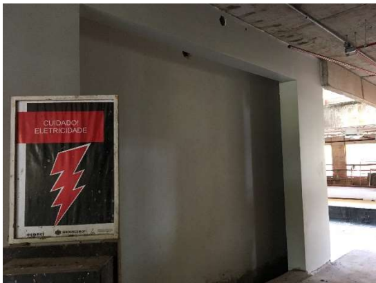
14 – Preparação de shafts para colocação de quadros elétricos.