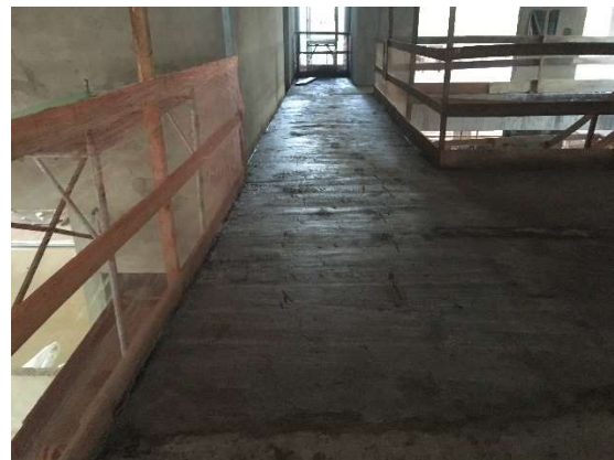
04 – Piso de regularização.