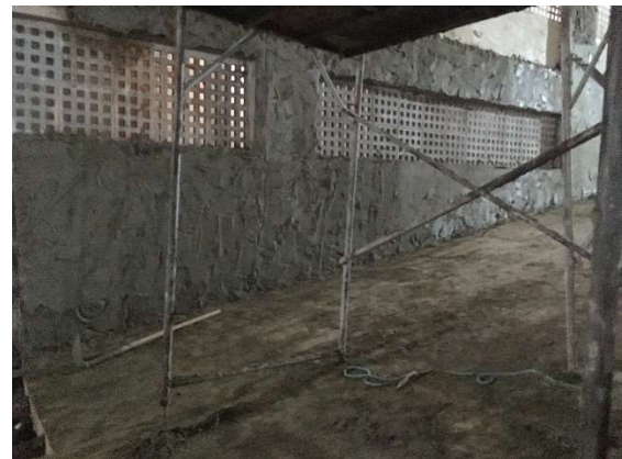
15 – Chapisco e reboco diversos, elemento vazado.