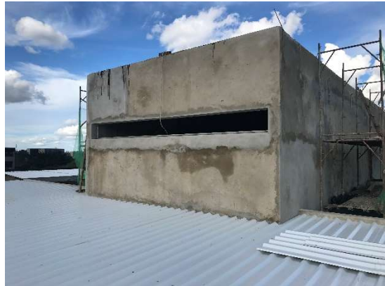
10 – Reboco de fachada, telhado e requadro de contra marcos.