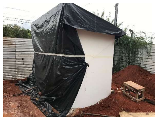
17 – Painel de medição alocado e protegido no interior do cubículo de medição.