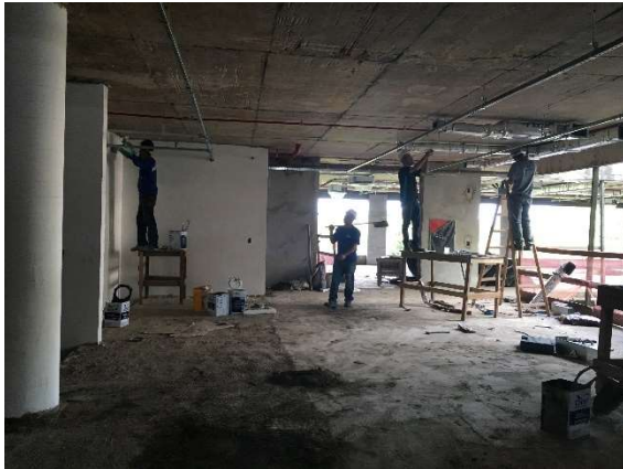
09 – Emassamento de paredes, colocação de dutos do sistema de ar condicionado.