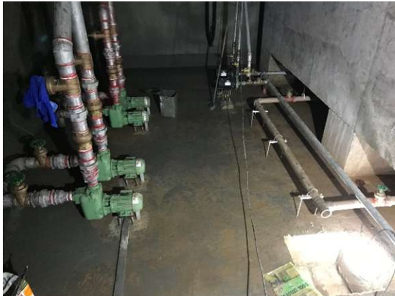
07 – Bombas de recalque, reservatório inferior.