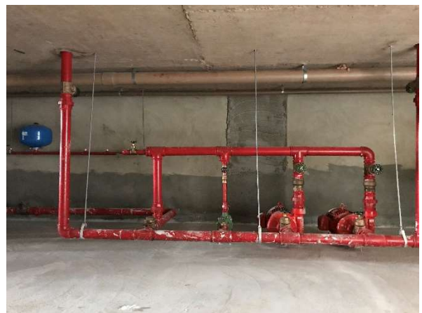
12 – Bombas de incêndio no barrilete do reservatório superior, piso granilite.