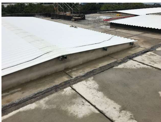
05 – Colocação de telhas, execução de proteção mecânica.