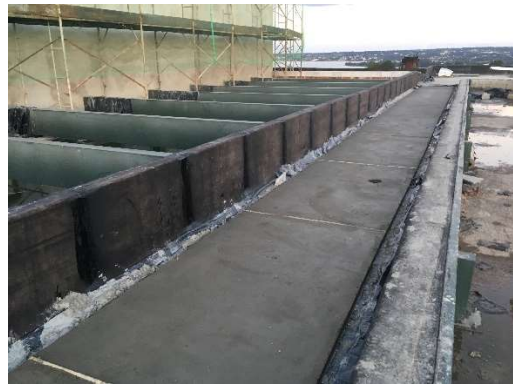
02 – Execução de proteção mecânica sobre manta.