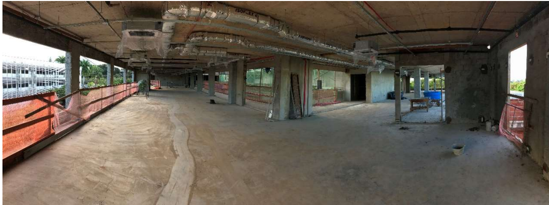
13 – Execução de sistema de ar condicionado, redes de dreno, dutos de renovação de ar.