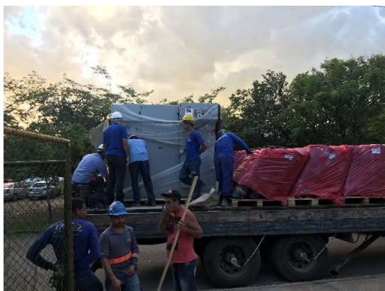
16 – Chegada do painel medidor.