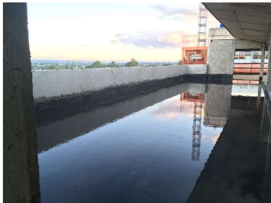
03 – Teste de permeabilidade sobre manta.