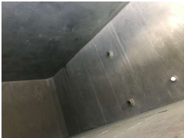
11 – Impermeabilização de reservatório.