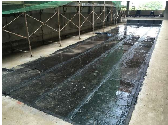
08 – Impermeabilização de áreas de jardim.